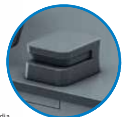
* Sensor de mídia